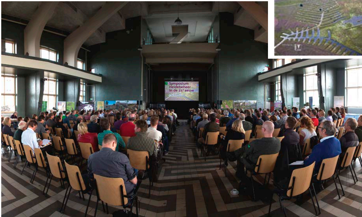
Een grote opkomst tijdens het symposium Heidebeheer in Radio Kootwijk.