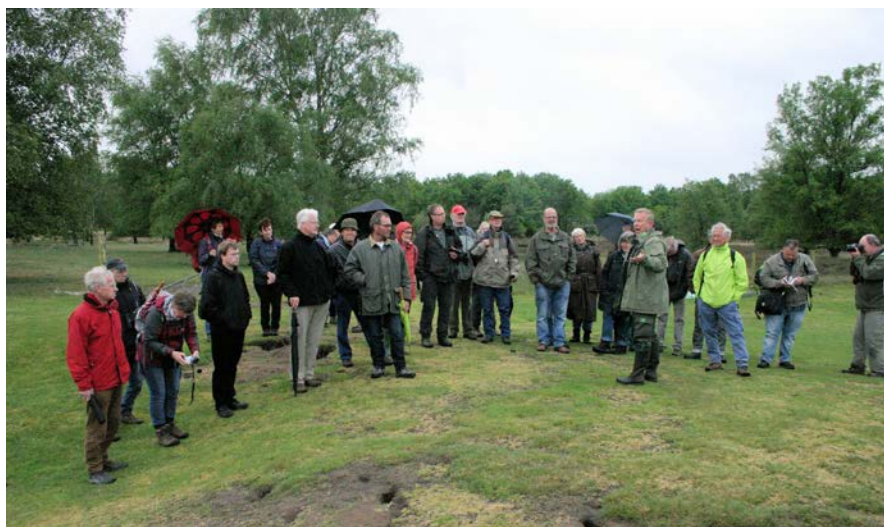
Workshop Heidebeheer op de Strabrechtse Heide voor vrijwilligers van IVN Limburg en Noord-Brabant en georganiseerd door EIS Kenniscentrum Insecten, Staatsbosbeheer, De Vlinderstichting en IVN Roermond.