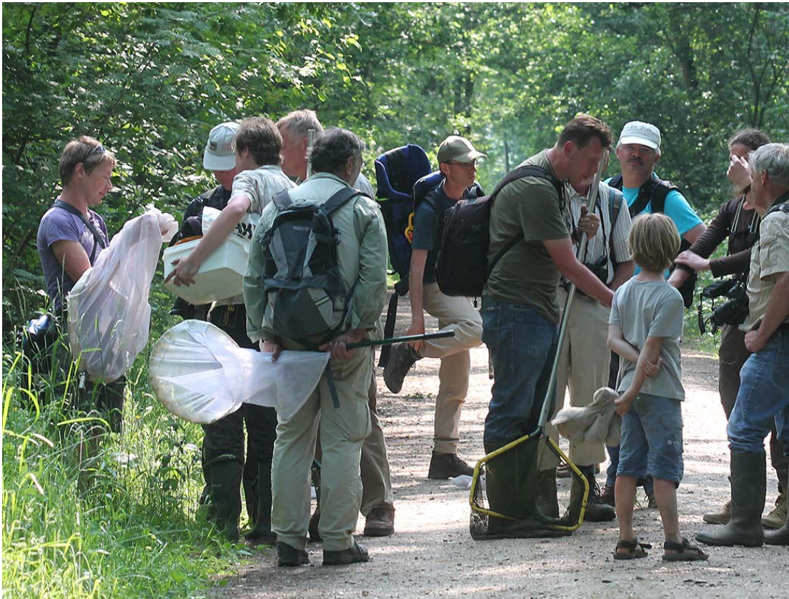
Het onderzoek op de 1000-soortendag in het Roerdal.