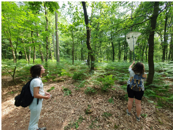
Groene trainees leren hoe je gaasvliegen en andere insecten zoekt.

Op zaterdag 16 juni was er de afsluitende excursiedag "24 uur natuur" voor de Groene Trainees . De enthousiaste en leergierige trainees kregen allerlei excursies voorgeschoteld, waaronder een gaasvliegenexcursie 's middags en nachtvlinderexcursie in het holst van de nacht. Dit leverde veel leuke dieren op, maar helaas wat gaasvliegen betreft alleen enkele algemene soorten, zoals strobruintje, gewone gaasvlieg en goudoogje. Desalniettemin was het een bijzonder geslaagde avond, met veel andere soorten!