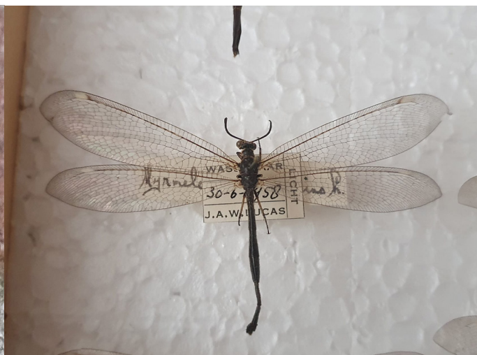
De tweede (links) en eerste (rechts) zwartkopmierenleeuw voor Zuid-Holland.