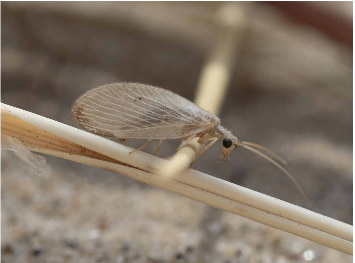
Eén van de helmbruintjes van de Ouddorpse strandopgang.

Mocht je dus in de buurt wonen van, of bij strand verblijven deze zomer, schroom dan niet om eens (met toestemming) te gaan nachtvlinderen in de duinen. Wie weet kom je er ook eentje tegen, en kun je ons helpen om de verspreiding beter in kaart te brengen!