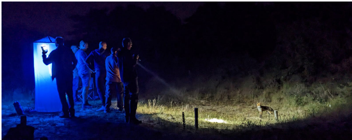
Een vos komt de gaasvliegenzoekers inspecteren tijdens de BioBlitz Katwijk.

De warmteprík heeft na lange vertragingen er voor gezorgd dat er eindelijk goede aantallen gaasvliegen zijn gaan vliegen! Het is interessant dat vooral groene gaasvliegen de afgelopen dagen veel worden waargenomen, terwijl de bruine gaasvliegen nog een beetje achter blijven. Intussen is het project in vol gas zich aan het ontwikkelen, met zelfs een ObsIdentify Challenge om een groter publiek te trekken!