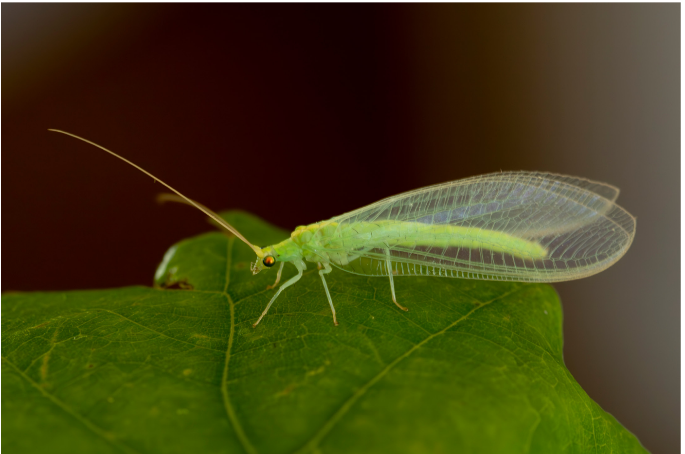
De Gele gaasvlieg op de Meinweg, met zwarte dwarsaders aan de basis.

Gaasvlieg of verwant gezien? Voer hem in met goede foto's op Waarneming.nl !